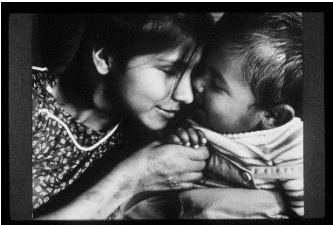
Figura 8. Joanna Pinneo, “Happy reunion”.

asistencia. En unos de estos hospitales vieron un niño de no más de un año que extendía sus brazos y lloraba, al que le tomaron una fotografía. Para cuando la fotógrafa regresó a Estados Unidos, Associated Press había publicado la imagen, un periódico local la reimprimió y la televisión local la retomó hasta que la madre y el niño se reencontraron. Varios meses después la fotógrafa tomó el registro de la familia reunida. 61 Por su trabajo ganó igualmente el tercer puesto en el Magazine Photographer of The Year Award (POYi) de la Asociación Nacional de fotografía de prensa de los Estados Unidos en 1986. El POYi fue fundado en 1944 como una exhibición y un concurso patrocinado por la Escuela de Periodismo de Missouri. Su propósito explícito era rendirle un tributo a aquellos fotógrafos de prensa que ejercían su oficio a pesar de las dificultades de la guerra. En el archivo de POYi reposan en total nueve fotografías sobre Armero, en su gran mayoría hechas por Carol Cuzy. Bajo el título de “Reunión feliz” puede encontrarse la galardonada fotografía del bebé con su madre. 62