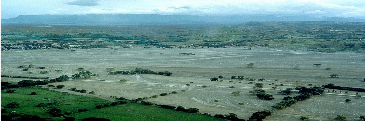
Figura 12. Fotografía: vista aérea del desastre. Autor desconocido. 1985.

Andes. 100 En un sentido parecido, cabe argumentar que el uso reiterativo de los aviones y el punto de vista que se obtiene desde el aire, permitió nuevas formas de mirar en las que también está presente el placer estético de la devastación. Una fotografía típica de Armero vista desde el aire y cubierta de lodo como la que se incluye a continuación es un buen ejemplo del tipo de panorama al que se enfrentaron los que sobrevolaron el área del desastre.