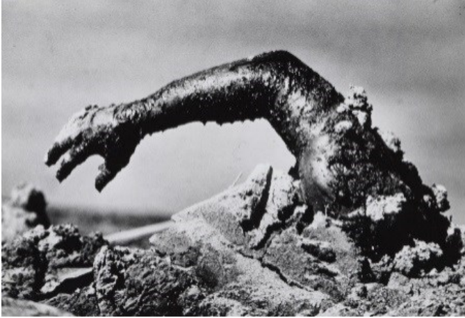
Figura 5. Carol Guzy, World Press Photo, 1985.

El contraste entre esta y otras imágenes de la misma persona es una forma de penetrar en las muchas opciones que se le presentan a un fotoreportero en situaciones tan dramáticas. Guzy logró registrar, por ejemplo, el momento en el que un helicóptero jala a una persona con una cuerda. En otra imagen, algunas personas tratan de identificar familiares en medio de una serie de cuerpos ya fallecidos. Una fotografía particularmente explícita da cuenta de una señora ensangrentada y sin vida que se encuentra en un tejado. En otra, un hombre carga a otro hombre, mientras escapan del desastre. Una foto panorámica, con seguridad tomada desde uno de los helicópteros, da cuenta del playón de lodo al que fue reducido Armero. En otra fotografía una señora llora identificando a sus seres queridos. En una más, una carretilla es utilizada por varias personas para sacar a un herido. En otra, le ponen agua a una señora cuyos ojos tienen lodo. Como lo explicarán después algunos de los sobrevivientes, la concentración de azufre convertido en lodo quema la piel de las personas. De ahí la premura por el agua.