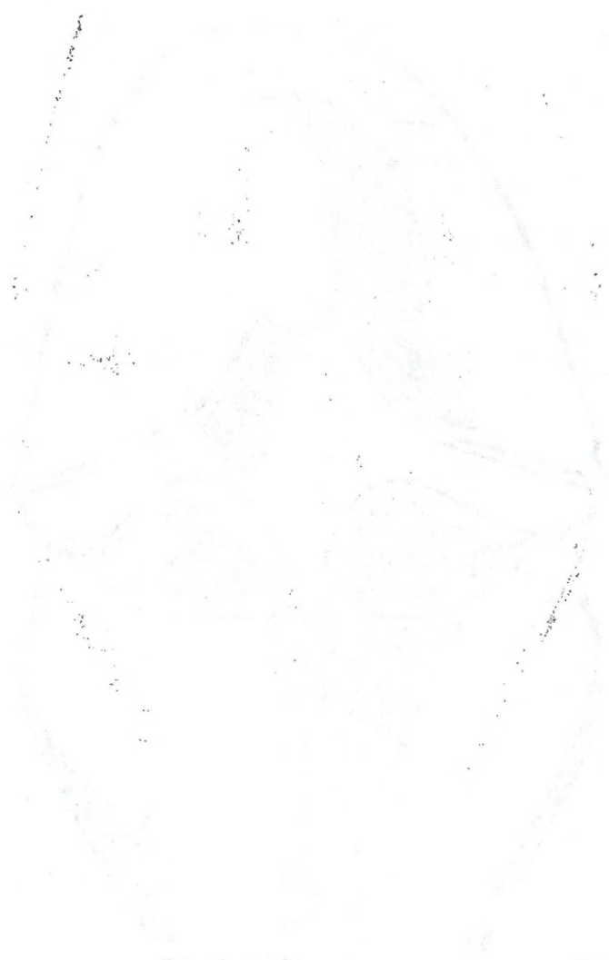
Diagram of a cell showing internal structures.