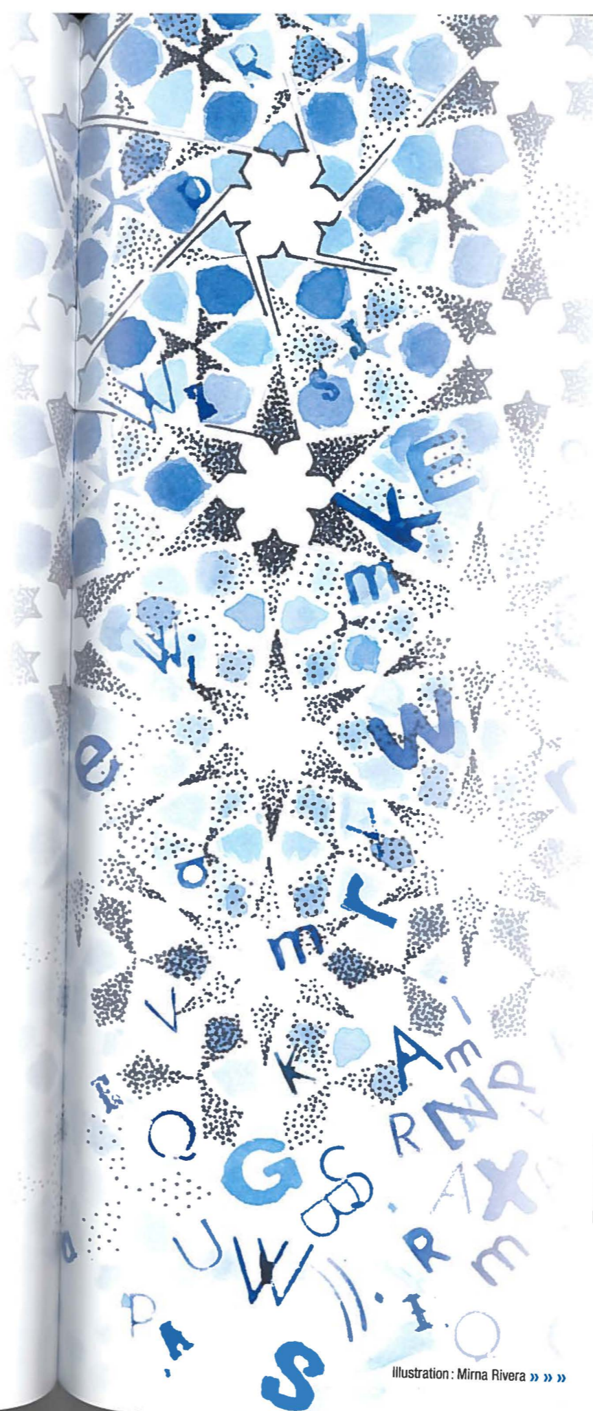
Illustration : Mirna Rivera » » »

Mais ces changements dérangent l'institution éditoriale qui est mise en cause : les institutions sont appelées à