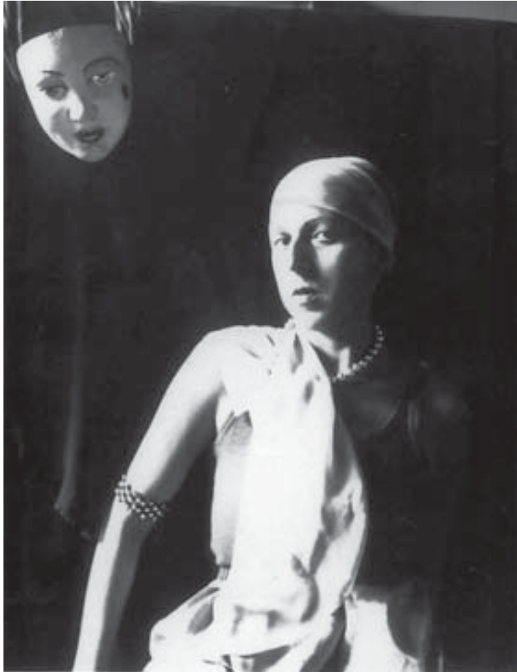
Fig. 6. Claude Cahun, Autoportrait , vers 1928, coll. Musée des Beaux-Arts, Nantes.

copie. Il est vrai que le motif du double est omniprésent dans les autoportraits réalisés entre 1912 et 1947. C'est grâce au jeu des masques que le « je » se dote toujours de nouveaux visages. La célèbre phrase, souvent citée depuis, insérée dans le « Tableau X » (fig. 5), rend ces mascarades explicites : « Sous ce masque un autre masque. Je n'en finirai pas de soulever tous ces visages. » (ANA, p. 212) Cependant, à force de trop s'amuser avec les masques, la décalcomanie peut réserver des surprises :