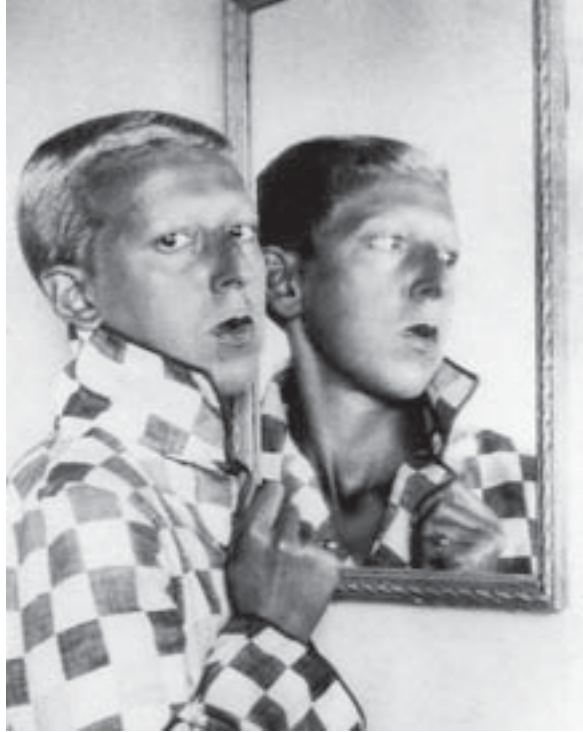
Fig. 1. Claude Cahun, Autoportrait , 1928, coll. Musée des Beaux-Arts, Nantes, coll. privée, Évreux.

complémentarité entre Cahun et Moore, il faut s'attarder sur les détails de leur autoreprésentation qui emprunte le plus souvent la voie de l'autoportrait photographique. L'emblématique « Autoportrait 21 » (fig. 1) de Claude Cahun devant un miroir, aux cheveux courts et au regard tourné vers le spectateur, qui