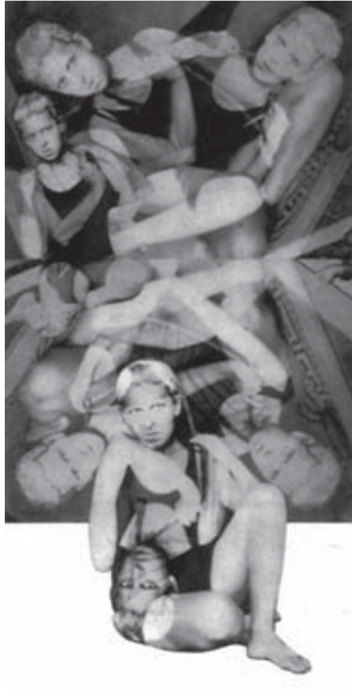
Fig. 7. Claude Cahun, Marcel Moore, Aveux non avenues, Tableau IX , Photomontage, 1929-1930, Éditions du Carrefour, Paris.

Le mythe de Narcisse est partout. Il nous hante. Il a sans cesse inspiré ce qui perfectionne la vie, depuis le jour fatal où fut captée l'onde sans ride. Car l'invention du métal poli est d'une claire étymologie narcissienne. Le bronze — l'argent — le verre: nos miroirs sont presque parfaits. (ANA, p. 38)