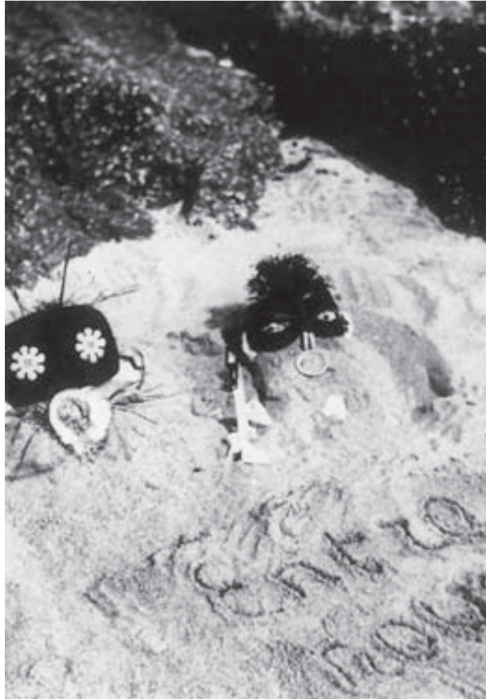
Fig. 10. Claude Cahun, Entre nous , 1926, Galerie Berggruen.

historiques de la « nouvelle femme » et du désir lesbien soulevaient comme question fondamentale commune, c'était la nécessité de repenser la norme hétérosexuelle sur les plans philosophique, médical, social et politique, de comprendre cette nouvelle apparence et la pratique érotique qui lui est associée comme la déstabilisation des frontières assignées entre les deux sexes, de les accepter comme la crise des catégories perçues volontiers comme stables, de