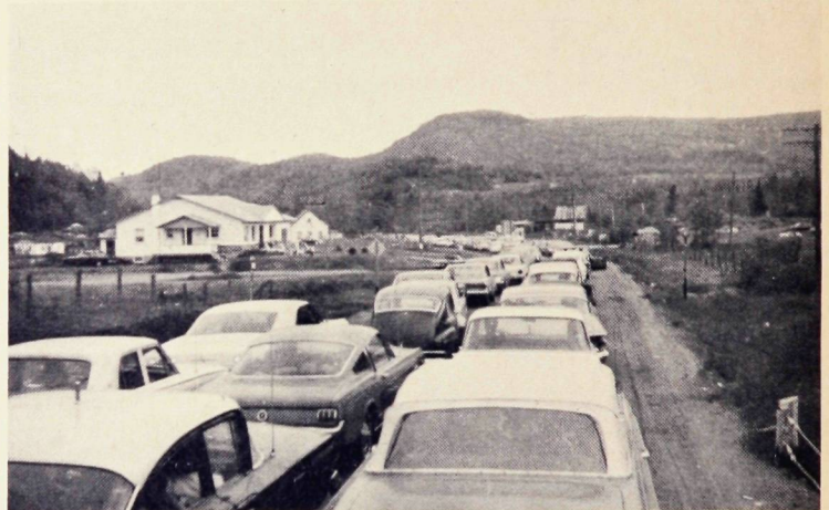
Plusieurs sont déjà inscrits et attendent avec impatience le moment du départ.

DÉPART: Université de Montréal. (Stationnement à l'arrière du Polytechnique)