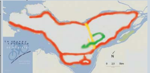
D'après Ville de Montréal, 2007.

Le réseau comporte 3 parties principales; la section rouge, qui fait le tour de l'île, la section verte reliant les grands parcs montréalais, et la section jaune qui permet de traverser l'île du nord au sud. La majorité du réseau est accessible entre avril et la mi-novembre et n'est pas entretenu l'hiver. On trouve environ 9 000 stationnements à vélo à Montréal, donc environ 5/1000 habitants, un ratio peu élevé comparativement à plusieurs villes nord-américaines. Le vélo est permis dans le métro hors pointe ainsi que dans deux lignes de train de banlieue, mais est interdit à bord des autobus.