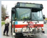
Support à vélo pour autobus (Ville de Toronto, 2007)

Ce projet vise à identifier les mesures susceptibles de favoriser le vélo utilitaire à Montréal, en tenant particulièrement compte des variations climatiques saisonnières.