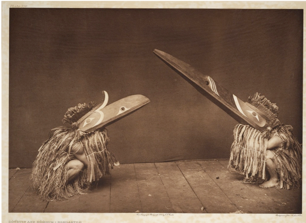
Edward S. Curtis. Kotsuis and Hohhuq - Nakoaktok (Smithsonian Institution)

Cette photo a tout de suite déclenché chez moi un « oh! » de surprise lorsque je l'ai vue : j'étais tout heureux de la retrouver sur ce site. Depuis plusieurs années, j'ai une grande admiration pour les cultures autochtones de la côte Ouest, pour la beauté et l'ingéniosité de leurs artefacts performatifs, comme les masques avec des parties mobiles actionnées par les danseurs. Je suis fasciné par le jeu sur l'échelle et la fusion que ces masques opèrent entre l'humain et l'animal. Dans l'image de Curtis, les deux personnages accroupis me parlent aussi d'espiègleries et de l'enfance. C'est également le souvenir impérissable d'un magnifique spectacle de danses autochtones auquel j'ai assisté l'an dernier à Vancouver, en compagnie d'un ami très cher, où j'ai vu ces masques en action pour la toute première fois.