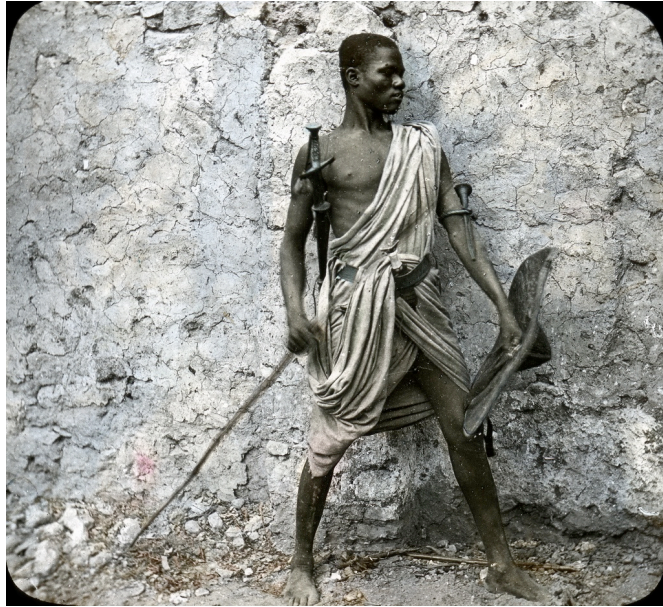
T. H. McAllister, Egypt: Nubian , plaque de lanterne magique (Brooklyn Museum)