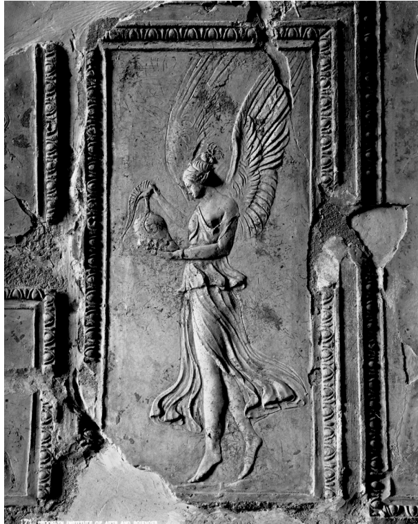
Farnesina Villa, Troja, Italy, 1895. (Brooklyn Museum)

Cette photographie est comme l'image-miroir féminine de mon guerrier nubien; je suis frappé par sa légèreté, j'ai le vertige devant cette présence dansante, presque vivante; les cassures du plâtre soulignent par ailleurs la fragilité de cette décoration stucquée; le détail du casque à cimier lui confère un accent funéraire, un relent de mélancolie. Elle équivaut pour moi à une forme de méditation sur la mort.