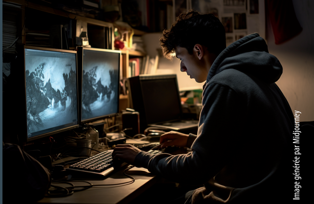
Image générée par Midjourney