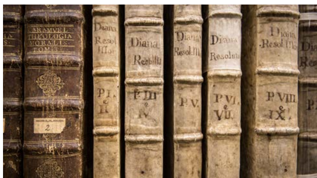
Reliures de parchemin et de veau brun.