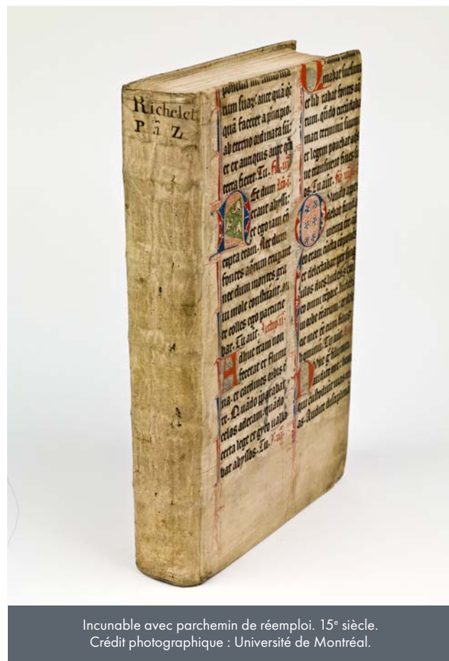
Incunable avec parchemin de réemploi. 15 e siècle.

Si les plus anciens documents remontent à l'Antiquité – avec des tablettes d'argile en écriture cunéiforme ayant jusqu'à 4000 ans d'âge – et au Moyen Âge – avec quelques manuscrits sur parchemin ou papier – l'essentiel des collections reste cependant constitué d'imprimés du 15 e au 20 e siècle.