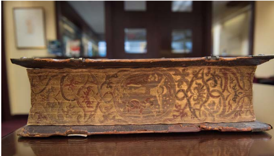
Bible de Plantin, tranches finement ciselées, 1583.

Le manuscrit et l'imprimé étant indissociables de la reliure, c'est l'histoire intégrale du bel « habillage des livres » qui se dévoile devant les yeux de qui explore les collections de la BLRCS.