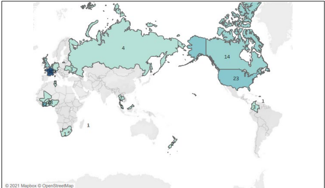
Carte 1. Provenance des numéros de téléphone signalés, Signal-Arnaques.

À la lumière de cette carte, on constate que les numéros de téléphone signalés proviennent de 26 pays différents. Presque l'entièreté des numéros provient de la France (1303). Ceci pourrait venir déconstruire l'idée populaire selon laquelle la majorité des arnaqueurs exécuteraient les arnaques depuis l'Afrique. En outre, ceci pourrait indiquer que les escrocs étrangers entretiennent des liens avec des complices en France ou encore qu'ils utilisent des outils technologiques pouvant cacher la réelle localisation associée au numéro de téléphone. Nous pouvons ici faire un lien avec la typologie de fraudeurs énoncée par Rege (2009) qui propose qu'une partie des fraudeurs sentimentaux agissent en petit groupe ou à travers un large réseau criminel. On retrouve également quelques cas en Côte d'Ivoire (32), au Bénin (28), aux États-Unis (23), au Royaume-Uni (15) et au Canada (14) (voir l'Annexe 3).