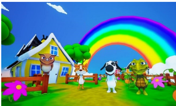
Figure 2. Screenshot of the video game Bubbles® ( http://www.oniric-interactive.com/ ).