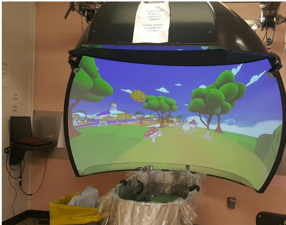
Figure 1. Projecteur en dôme de réalité virtuelle installé à la salle d'hydrothérapie pour les soins aux enfants brûlés.

Le jeu Bubbles® a été conceptualisé et réalisé par un partenariat entre notre équipe de recherche comprenant des cliniciens et chercheurs en pédiatrie et en douleur et une équipe de spécialistes en génie informatique, environnements virtuels et 3D et jeux vidéo. Dans le jeu Bubbles, l'enfant a l'impression d'être dans un wagon de train qui se déplace à travers différents paysages soit une forêt, un village et une plage. Dans chaque paysage, des animaux font des grimaces drôles ou interagissent avec l'enfant qui peut leur lancer des bulles en cliquant sur une souris en poire imperméable à l'eau. Si l'enfant est trop jeune pour utiliser la souris ou est incapable de le faire (si par exemple sa main est submergée dans l'eau), un mode automatique se lance après 30 secondes d'inactivité pour lancer automatiquement des bulles maintenant ainsi l'interactivité des animaux dans le jeu.