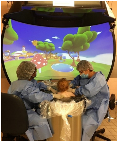
Figure 1. Virtual Reality Prototype at the hydrotherapy room of CHU Ste-Justine.