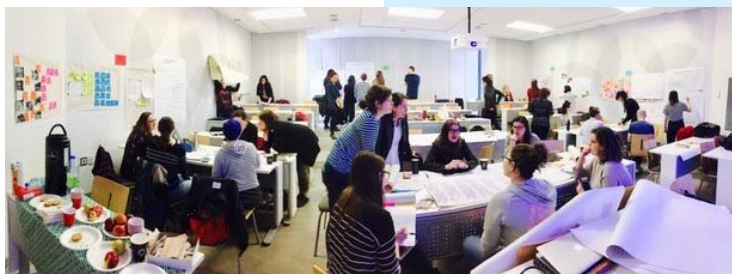
Les étudiants du cours SCI6124 et les professionnels participant à l'œuvre.