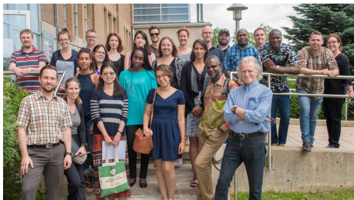
Cours Gestion d'un projet de numérisation