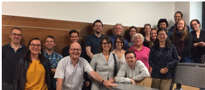
Cours Marketing et publics