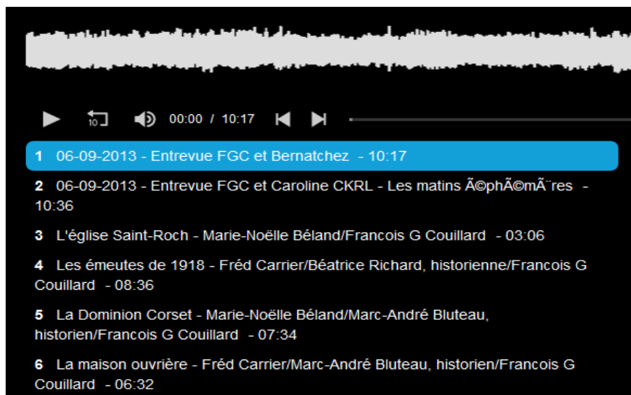
Figure 2. « Saint-Roch, une histoire populaire », fichiers audio, Internet Archive (stroch, 2013).

Le geste d'exploitation de Couillard est consultable sur les sites Web susmentionnés (Couillard, 2013, s. d.). Après ce geste, l'auteur du projet « Saint-Roch, une histoire populaire » se positionne à son tour comme donataire, déposant. Il procède au dépôt de documents audio sur le site Web Internet Archive en juillet 2013 https://archive.org/details/stroch 6 .