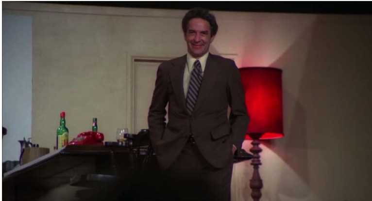
Maurice/Marty s'adresse à la foule, rit et la regarde directement

C'est un autre des « hors-sujets » d' Opening Night : Myrtle devra trouver le moyen d'entraîner Maurice non plus à jouer la pièce, mais à se jouer d'elle, et ce, devant le grand public de la première à New York. Plus encore, une telle dédramatisation deviendra le nouveau point focal du film, le nouveau noyau de l'action. Du même coup, cette action déterritorialisée (en ce qu'elle passe de l'écrit dramatique à l' acte ) devient un vecteur existentiel : c'est en redramatisant The Second Woman que Myrtle et Maurice, improvisant devant la foule new-yorkaise, en viendront à s'aimer à nouveau et à poursuivre leur idylle, sur une scène où la conjugalité s'exprime et où rien ne préexiste, sinon l'acte, les forces et les puissances.