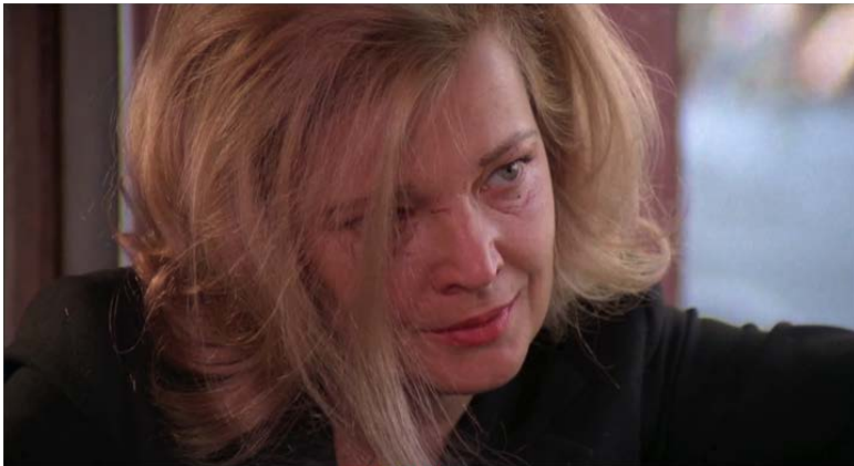
Le regard de Myrtle/Dionysos

À l'inverse, le dionysiaque est un regard de voyant, un regard, comme le dit Nietzsche, « jeté sur l'horreur de la vérité 27 » : un art d'interpréter et de percer les masques, c'est-à-dire de détruire les clichés. Dans Opening Night , passant de l'apollinien au dionysiaque pour atteindre une nouvelle forme d'harmonie (harmonie de l'ivresse et du retournement), le théâtre devient ainsi son propre double.