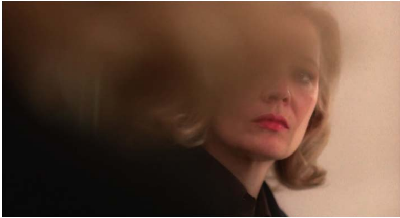
Myrtle et les images dans le miroir

La première apparition de Nancy se fera, d'ailleurs, dans un miroir, celui de la loge de Myrtle, élément de mise en scène qui nous permet de formuler le constat suivant : Nancy est le double apollinien de Myrtle ; elle perpétue le monde des images dans l'univers mental de l'actrice.