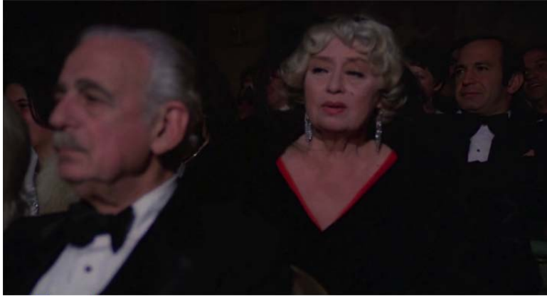
De l'avant à l'arrière-plan : réactions mitigées du producteur, de l'auteure et du metteur en scène de la pièce enchâssée dans Opening Night

On citera à bon escient une grande partie de leur conversation, qu'ils ont non plus en tant que « Virginia » et « Marty » (même s'ils continuent à se répondre en utilisant les prénoms de leurs personnages), mais en tant que Myrtle et Maurice (et il ne faut pas oublier qu'il s'agit du couple réel Rowlands/Cassavetes) :