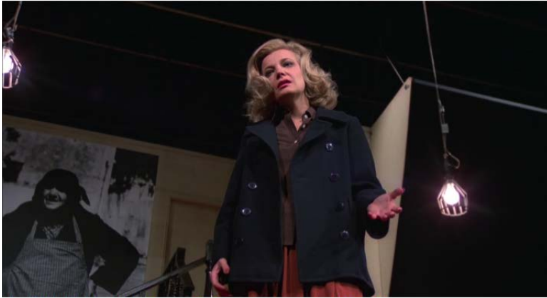
Myrtle/Virginia et le théâtre comme discours second

acteur « secondaire », ne peut risquer de braver l'autorité du metteur en scène et du producteur pour supporter l'actrice, « en direct », dans sa refonte de la pièce).