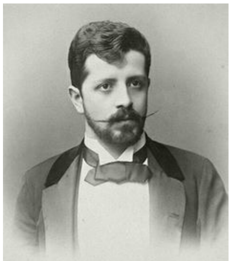
Portrait de Richard Beer-Hofmann, non daté.