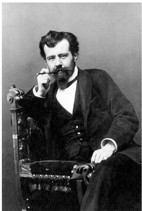
Portrait de Hermann Bahr, en 1891.