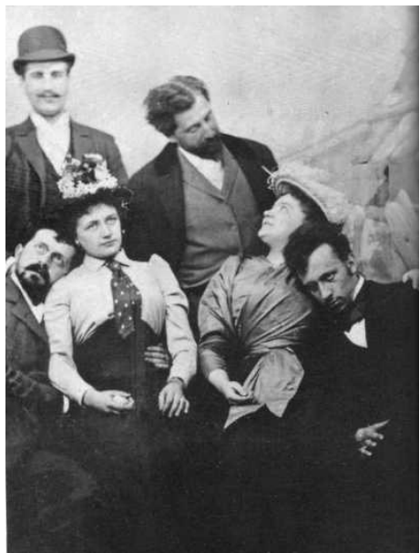
Sur cette photo : Hugo von Hofmannstahl (debout à gauche), Arthur Schnitzler (debout à droite), Richard Beer-Hofmann (assis à gauche), Felix Salten (assis à droite), et deux jeunes femmes, au Prater, en 1894.