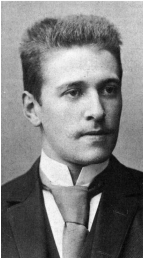
Portrait de Hugo von Hofmannstahl, en 1893.