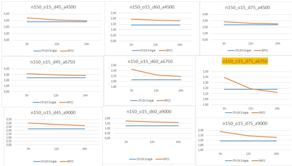
Figure 5.1 : Amélioration du gap (%) dans le temps entre BPCC et CPLEX Single