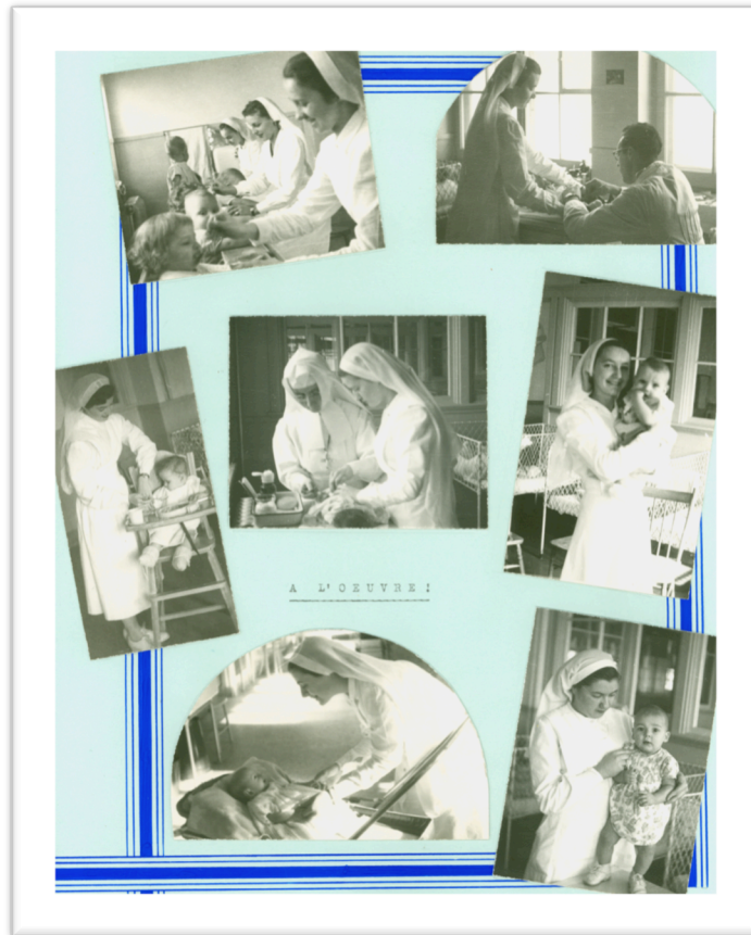
ASBPQ, Album 21b-13, « Les puéricultrices à l'œuvre, vers 1950 », s.d..

Plus encore que les autres infirmières à domicile, la puéricultrice, par sa présence constante, investit la vie privée des familles. Elle porte le discours médical jusque dans leur quotidien et s'assure du changement de leurs habitudes. Cette intrusion contribue, comme le note Baillargeon, à l'intégration des pratiques