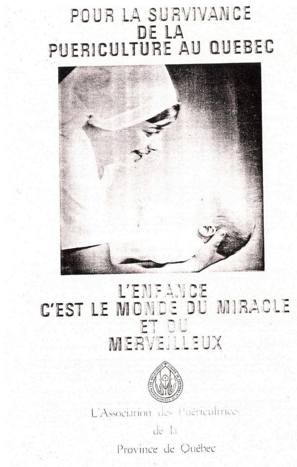
Illustration VIII : Pour la survivance de la puériculture au Québec

APPQ, « Pour la survivance de la puériculture au Québec », document non daté, dossier « Historique ».