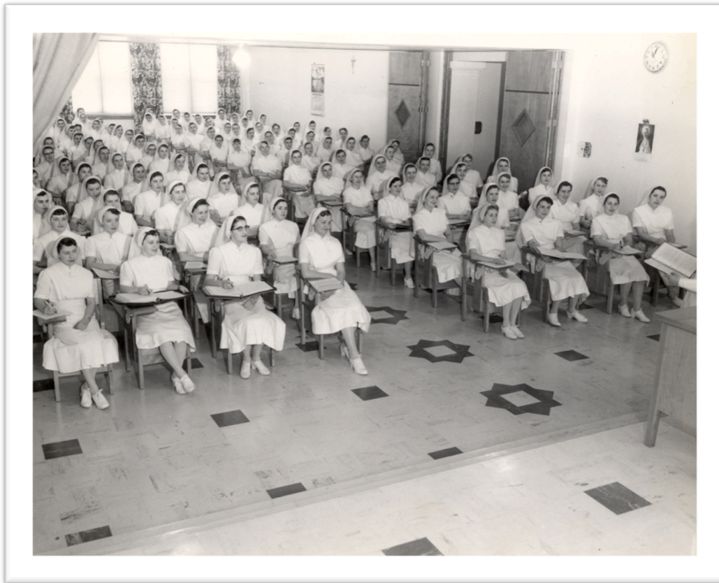
ASBPQ, Fonds PH-G-10,21-06, « Salle de cours de l'École de puériculture », 21 avril 1955.

Ainsi, les premières écoles de puériculture naissent en raison de la nécessité de spécialiser le personnel dont le but premier est de contrer une mortalité infantile élevée au sein des crèches du Québec. Fortement imprégné des idées véhiculées par certains groupes tels que la FNSJB, le contenu de ces formations est à l'image de ce