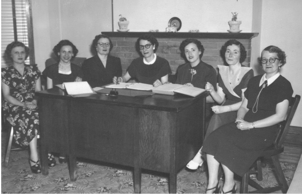
ASCM, Fonds L002, L1, 11, « Crèche d'Youville_Puéricultrices et gardes-bébés_Conseil-Association des gardes-bébés_1952 »

Les premières écoles de puériculture naissent donc dans un contexte de multiplication des services destinés aux soins des enfants et à l'éducation des mères. Ce mouvement est porté par divers acteurs sociaux, dont un corps médical nécessitant des auxiliaires féminines aptes à porter leur message, mais aussi par des organisations féministes maternalistes, comme la FNSJB, qui défendent une formation répondant au rôle que les femmes seront appelées à jouer au sein de leur foyer. Dans ce tableau, les puéricultrices, formées en crèche parmi les enfants « abandonnés », travaillent comme « mères spécialistes » auprès des mères de