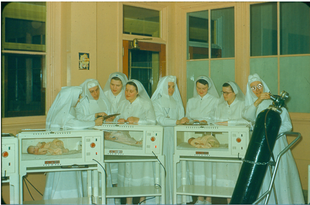
« Des étudiantes surveillent des bébés en incubateur », s.d..

En 1966, le programme des écoles de la FEPPPQ est unifié et supervisé par des pédiatres. La formation est portée à deux ans, soit 480 heures en plus des stages