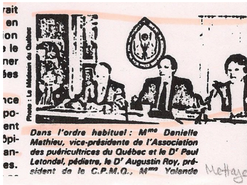
Illustration IX : Les médecins aux côtés des puéricultrices

BAnQQ, Fonds E150,1988-04-001/1, « Puéricultrice Stages cliniques dans les hôpitaux », Le médecin du Québec , janvier 1983, p. 21.