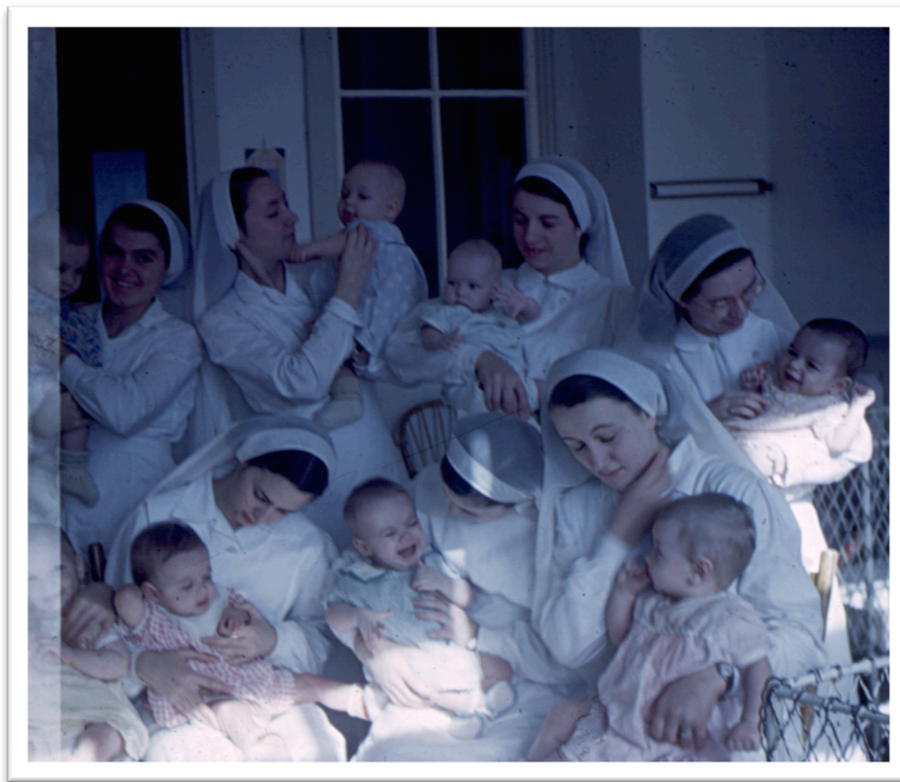
ASBPQ, Fonds D-10,09-157, « Étudiantes en puériculture avec les enfants », s.d..