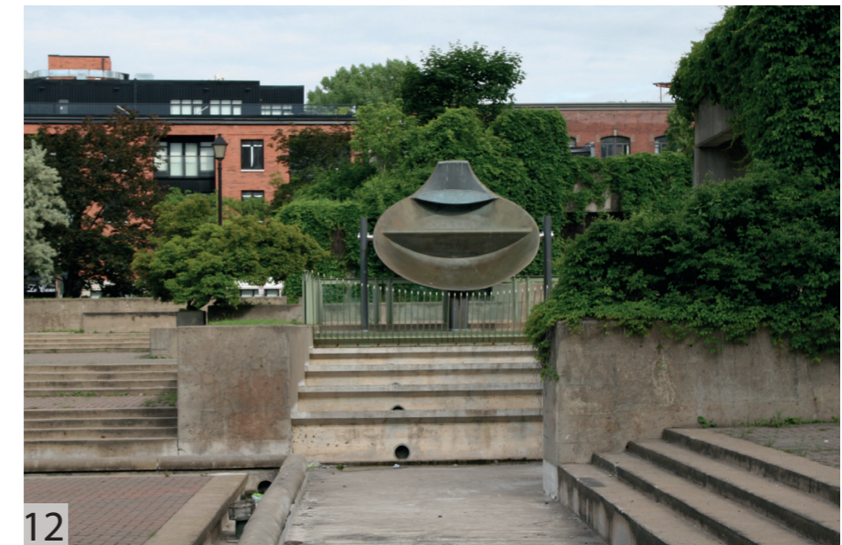
12 Mastodo de Charles Daudelin

Aujourd'hui, un lieu d'une telle importance requiert une grande attention, tant au sujet de son usage que de son design, qui tous deux, de manière indissociable, forment la grande valeur du Square Viger.