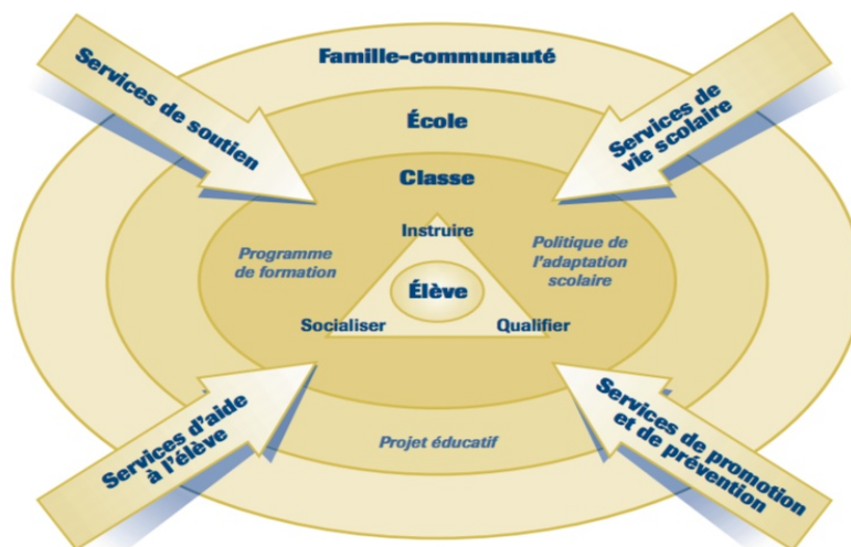
Figure 2. Conception des services éducatifs à partir des modifications apportées à la LIP, du programme de formation de l'école québécoise, la nouvelle Politique de l'adaptation scolaire et ses voies d'action