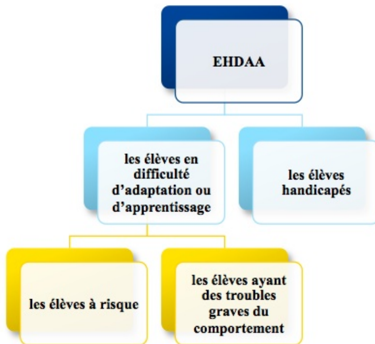
Figure 3. Catégories des élèves handicapés ou en difficulté d'adaptation ou d'apprentissage établies par le MEQ en 2000

Le MEQ utilise et définit pour la première fois la catégorie élèves à risque. Ils sont définis par le MEQ comme ceux « à qui il faut accorder un soutien parce qu'ils présentent : des difficultés pouvant mener à un échec, des retards d'apprentissage, des troubles émotifs, des troubles du comportement, un retard de développement ou une déficience intellectuelle légère (MEQ, 2000, p.5). Cette définition renvoie à l'orientation fondamentale de la Politique qui vise à « aider l'élève handicapé ou en difficulté d'adaptation ou d'apprentissage à réussir sur les plans de l'instruction, de la socialisation et de la qualification (1999, p.17) et place la nature du risque au centre des préoccupations éducatives. En ce sens, une définition spécifique des élèves à risque est élaborée pour chaque niveau d'enseignement (MEQ, 2000). En effet, le concept d'élèves à risque est associé à la prévention des difficultés (Goupil, 2007 ; Benoit, 2005). Par ce regroupement d'élèves en difficulté sous la catégorie élèves à risque, le MEQ en cohérence avec l'orientation de la politique vise une « approche individualisée » fondée sur