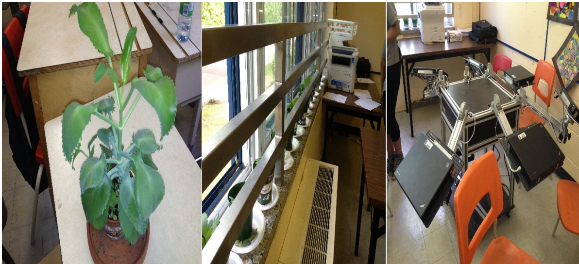
Figure IV : Leçon sur les plantes

La figure IV présente la séquence d'enseignement à laquelle nous avons assisté lors de notre observation. La leçon consistait en un retour sur l'activité pendant laquelle les élèves devaient