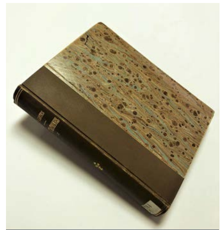
Un titre de Descartes dans une demi-reliure moderne - 1678

Enfin, la couverture et sa décoration nous donnent d'autres types de renseignements. Un livre de petit format recouvert de parchemin, sans fioritures, avec rabats attachés devant la gouttière nous indique qu'il s'agit d'un livre modeste destiné à être utilisé et transporté régulièrement (en étant exposé possiblement aux intempéries). Son examen révèle donc un livre utilitaire d'usage courant.