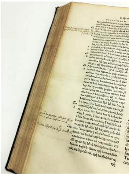
Exemplaire rogné ayant amputé les annotations manuscrites - 1522

C'est avec ces éléments en tête que le spécialiste regarde un livre ancien. Généralement, son premier réflexe le porte à vérifier si l'ouvrage est habillé de sa reliure d'origine. Car plus un livre ancien est près de son état d'origine, plus il a une grande valeur monétaire, mais également historique, puisque l'étude de sa matérialité (dont sa reliure) nous permet d'en apprendre plus sur sa fabrication, son utilisation et sa circulation à travers le temps. Certains signes ne mentent pas : des marges trop rognées (coupant parfois dans les annotations manuscrites), des fonds de cahier où l'on aperçoit des trous de couture vides (attestant d'une reprise de la couture), un style de reliure inapproprié pour l'époque (un bougran ou une demi-reliure à coins pour un 16 e siècle), une reliure apparaissant trop neuve, des gardes trop fraîches, des papiers marbrés ne correspondant pas à la période, indiquent souvent que la reliure n'est plus d'origine.