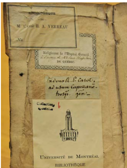
Un titre de Saint-Augustin dans sa reliure d'origine avec marques de provenance diverses - 1631

En conclusion, ce bref survol vise à rappeler qu'un livre produit pendant la période de l'imprimerie artisanale est pratiquement toujours un objet singulier, car il peut présenter différents états d'un texte, porter des marques de propriété (ex-libris) ou encore différentes marques de provenance (annotations, dessins, calculs, etc.) et enfin une reliure, comme nous venons de le voir, qui le rendent unique.